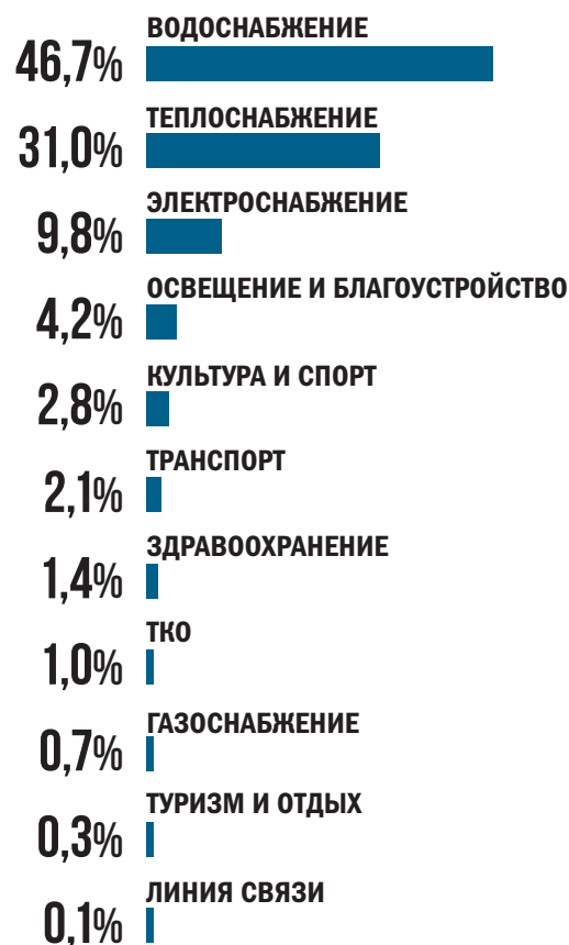
Рис. 2. Сфера реализации проектов, инициированных в порядке ЧКИ, %

к продекларированным сведениям, не являются основанием для признания заявки не соответствующей установленным требованиям.