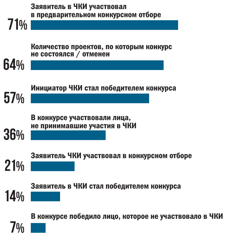
Рис. 3. Статистика конкурсов, проводимых по результатам ЧКИ, %

Таким образом, в настоящее время в законодательстве отсутствуют механизмы, которые защищали бы ЧКИ от перехода в конкурс, проводимый на основании заявлений тех лиц, которые на самом деле не имеют намерения участвовать в реализации проекта.